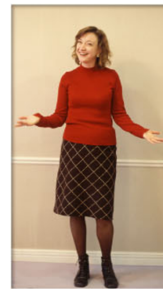
取材協力: 関セントラルジャパン http://www.central-f.com

「日本では、歯を治すというとお金もかかるし大変なのに、どうして？」という人が、今でもわりあいいる気がしますが、アメリカからすれば「どうして？」のほうは不思議。矯正歯科治療をすれば自分の歯でおいしいものが食べられるし、笑顔もよくなるわけですから、隠したり恥ずかしがりやで、前向きに治療を受けたいですね」